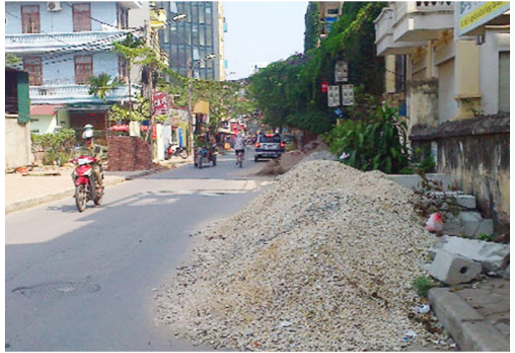
Tình trạng để vật liệu xây dựng “ngổn ngang” giữa lòng đường.