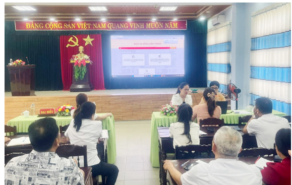
Sở Tư pháp tập huấn triển khai 02 nhóm thủ tục hành chính liên thông tại thị xã Hương Trà

Cùng với các ngành, các cấp, thực hiện chỉ đạo của UBND tỉnh, ngành Tư pháp đã chủ động ban hành các văn bản chỉ đạo gắn với nhiệm vụ của ngành để triển khai có hiệu quả, kịp thời các nhiệm vụ được nêu tại Đề án và Công điện số 104/CD-TTg ngày 29/01/2022 của Thủ tướng Chính phủ, đảm bảo dữ liệu, thông tin công dân trong Cơ sở dữ liệu hộ tịch điện tử được đăng ký chính xác, đúng quy định pháp luật, đồng bộ, thống nhất với thông tin công dân trong Cơ sở dữ liệu quốc gia về dân cư. Giai đoạn triển khai Đề án 06 trong năm 2022, Sở Tư pháp đã ban hành 13 Công văn chỉ đạo UBND cấp huyện thực hiện và phối hợp Công an tỉnh tăng cường chỉ đạo UBND cấp huyện nhằm triển khai có hiệu