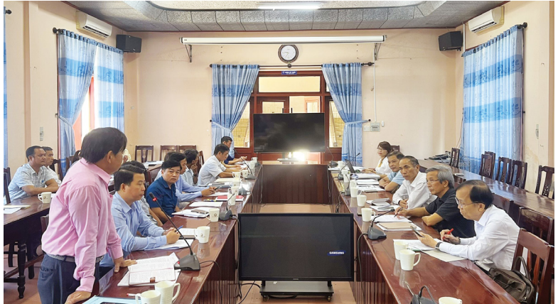
Hội đồng phối hợp phổ biến, giáo dục pháp luật tỉnh kiểm tra 10 năm thi hành Luật Hòa giải ở cơ sở và công tác PBGDPL, chuẩn tiếp cận pháp luật năm 2023 tại Ủy ban nhân dân huyện Phong Điền

Nhằm đảm bảo các quy định về hòa giải ở cơ sở được tuyên truyền sâu, rộng đến với các tầng lớp Nhân dân, trong 10 năm qua, Hội đồng Phổ biến giáo dục pháp luật (PBGDPL) cấp tỉnh, cấp huyện đã tổ chức hơn 300 đợt tuyên truyền, trong đó có các nội dung liên quan về hòa giải ở cơ sở với trên 70.000 lượt Nhân dân tham dự. Biên soạn, phát hành hàng trăm ngàn