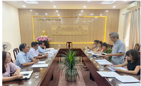
Đoàn Kiểm tra liên ngành tiến hành kiểm tra việc thi hành pháp luật về xử lý vi phạm hành chính tại Sở Lao động - Thương binh và Xã hội

Theo quy định tại khoản 3 Điều 15 Nghị định số 19/2020/NĐ-CP thì “ Trưởng đoàn kiểm tra ký ban hành kết luận kiểm tra trong trường hợp được người có thẩm quyền kiểm tra ủy quyền ”. Và tại khoản 2 Điều 10 Nghị định số 19/2020/NĐ-CP quy định “ Trưởng đoàn kiểm tra có thể ủy quyền cho phó trưởng đoàn kiểm tra thực hiện nhiệm vụ của mình ”. Trong trường hợp này, Trưởng đoàn kiểm tra có được ủy quyền cho phó trưởng đoàn kiểm tra ký ban hành kết luận kiểm tra hay không vẫn còn có các quan điểm khác nhau, cụ thể như sau: