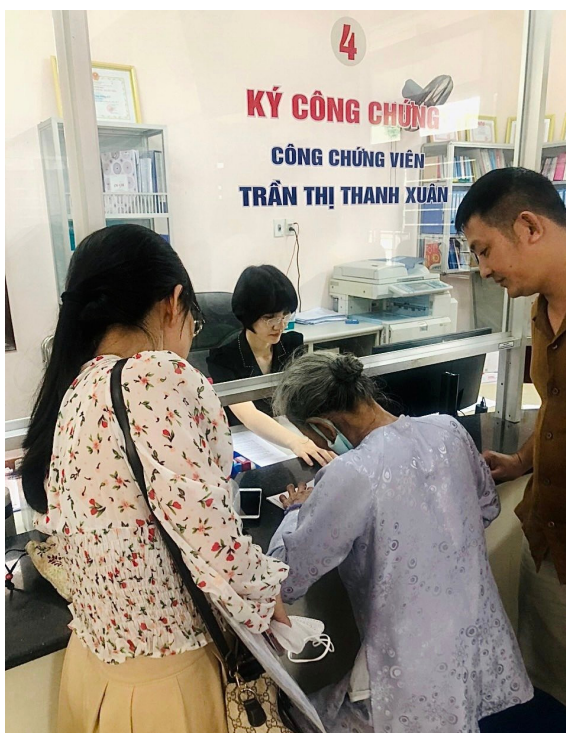
Công chứng viên Phòng Công chứng số 2 hướng dẫn người dân thực hiện các thủ tục công chứng hợp đồng, giao dịch

Khoản 3 Điều 3 Luật Quốc tịch Việt Nam năm 2008 (được sửa đổi, bổ sung năm 2014) quy định: “Người Việt Nam định cư ở nước ngoài là công dân Việt Nam và người gốc Việt Nam cư trú, sinh sống lâu dài ở nước ngoài.” Như vậy, người Việt Nam định cư ở nước ngoài gồm hai đối tượng, đó là: (i) Công dân Việt Nam cư trú, sinh sống lâu dài ở nước ngoài; (ii) Người gốc Việt Nam cư trú, sinh sống lâu dài ở nước ngoài.